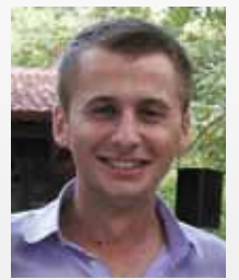
Γράφει ο Δημήτρης Χ. Πατσίκας Δικηγόρος

Η εν λόγω πρωτόγνωρη κατάσταση που βιώνει η Κύπρος αποτέλεσε αφορμή για να αναδειχθεί προς τα έξω μια ισχυρή προσωπικότητα: ο Αρχιεπίσκοπος Χρυσόστομος Β'. Ο προκαθήμενος της Εκκλησίας της Κύπρου αφουγκράστηκε την κοινωνία και βγήκε αμέσως μπροστά, προκειμένου να την εκφράσει και να την υπερασπιστεί. Από την αρχή δεν μάζησε τα λόγια του: όταν έγινε γνωστή η απόφαση του συμβουλίου των υπουργών οικονομικών της ευρωζώνης (ελληνιστί, Γιούρογκρουπ) για κούρεμα των καταθέσεων στις κυπριακές τράπεζες, έκανε λόγο για «προστυχία των Ευρωπαίων». Φαίνεται σε κανέναν άδικος αυτός ο χαρακτηρισμός;