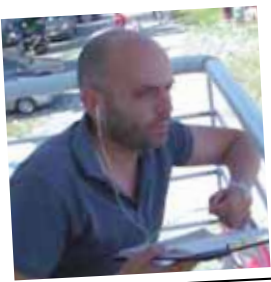
Από τον Αργύρη Τσιγγενόπουλο imathiasportsnews.wordpress.com