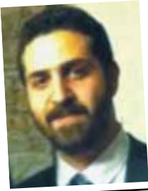
Γράφει και επιμελείται Άκης Πανακάκης Γεωπόνος - Βιοτεχνολόγος