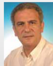
Από τον Κώστα Ασλάνογλου

Έκρινα τον παραπάνω πρόλογο απαραίτητο, προκειμένου να υποστηρίξω στη συνέχεια ορισμένες σκέψεις που στην περιοχή μας αποτελούν ταμπού για τους περισσότερους.